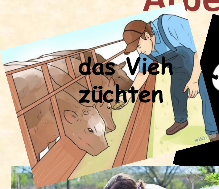
das Vieh züchten