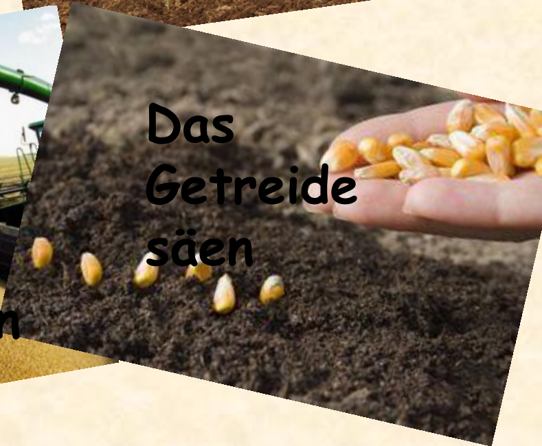
Das Getreide säen