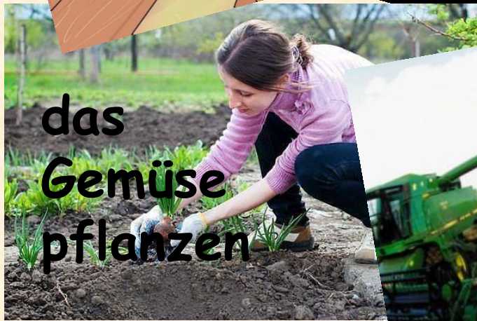
das Gemüse pflanzen