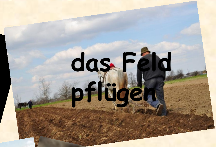
das Feld pflügen