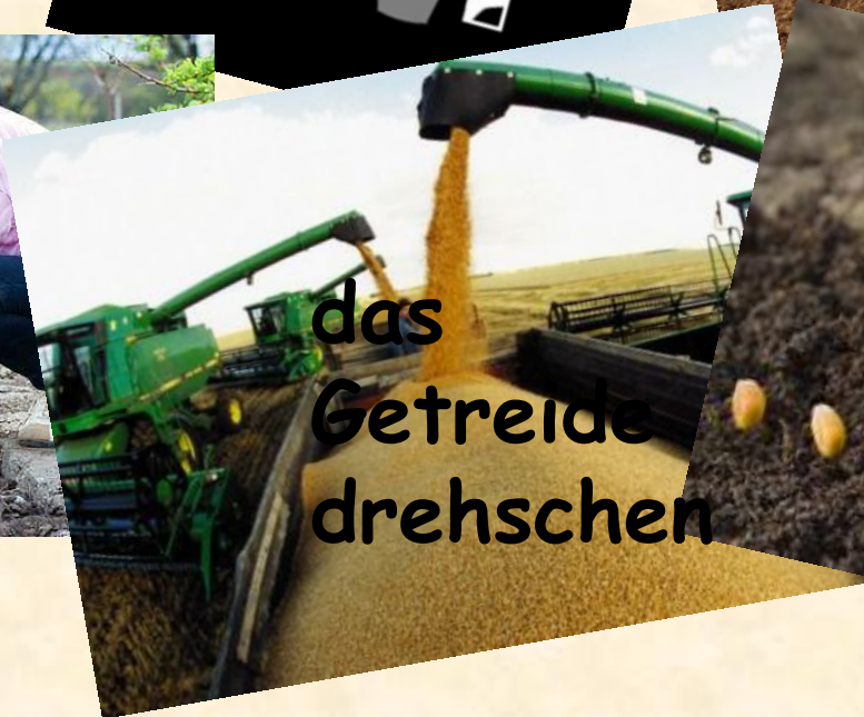
das Getreide dreschen