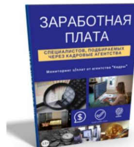
Заработная Плата 17 страниц