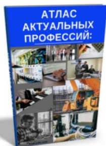
Атлас актуальных профессий 75 страниц

* ПРИМЕЧАНИЕ: КОЛИЧЕСТВО ПРОГРАММ И РАСПРЕДЕЛЕНИЕ МЕСТ МОЖЕТ МЕНЯТЬСЯ, УТОЧНЯЙТЕ