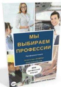
Мы выбираем профессии 57 страниц