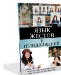
Язык жестов и телодвижений 25 страниц