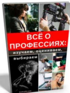
Всё о профессиях 139 страниц