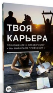
Твоя карьера 25 страниц