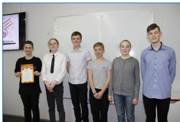
Команда 7 «Б» класса