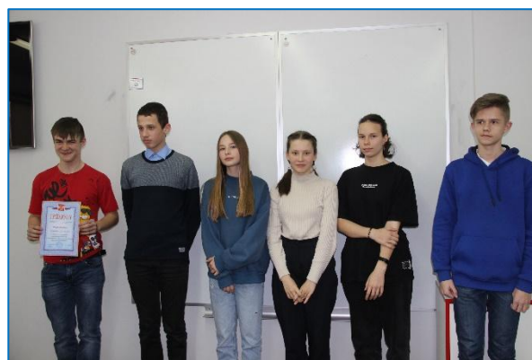
Команда 7 «Г» класса