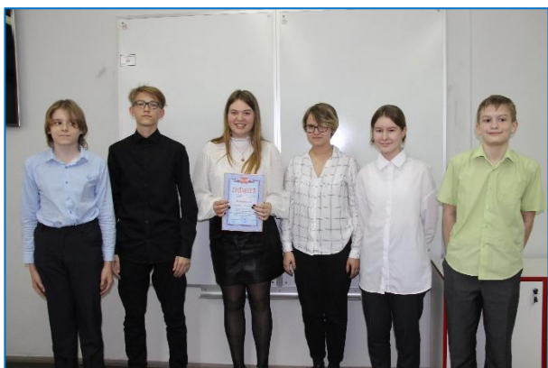
Команда 7 «В» класса