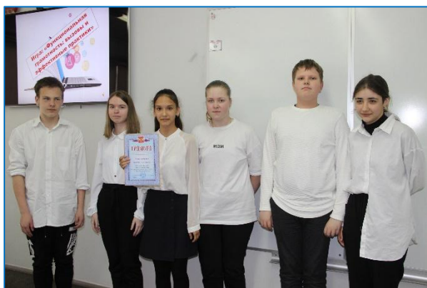
Команда 7 «А» класса