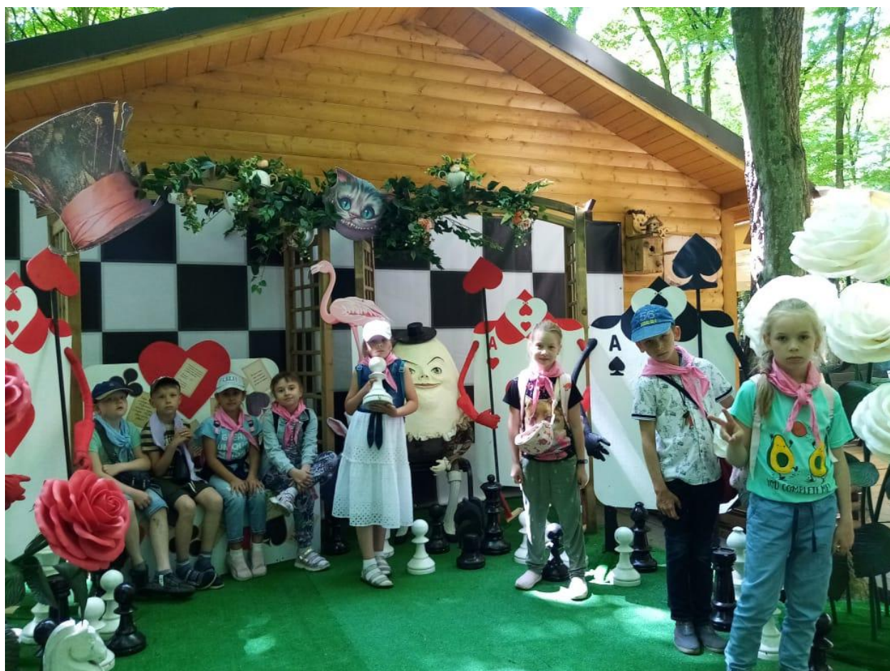
Викторина «Знаешь ли ты животных?». Спасибо городской библиотеке.