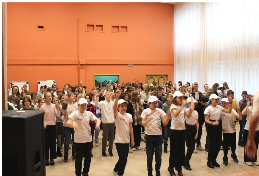
- физ-зарядка и спортивные игры – 7-8 классы спортивный зал.