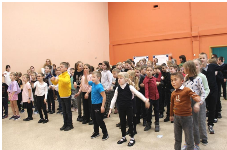
- физ-зарядка и спортивные игры – 9-11 классы – спортивный зал.