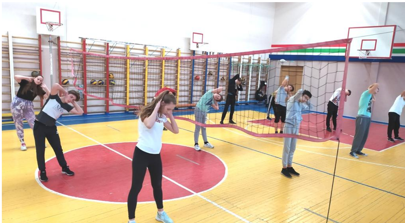
Классные часы «Мы выбираем жизнь», распространение информации о профилактике и способах лечения